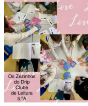
Clube de Leitura 5.ºA