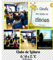
Clube de Leitura 6.ºA e 2.ºC

Alunos do 4.ºA elaboram a capa de A menina que sorria a dormir .