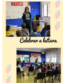
Celebrar a leitura