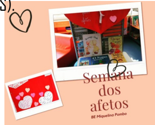
Semana dos afetos

Exposição de livros, leituras com turmas e elaboração de mensagens de afeto. Construção e venda solidária de Mar@fetas, pelas crianças fugidas da guerra em Cabo Delgado (PES).