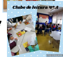
Clube de leitura 4.ºA