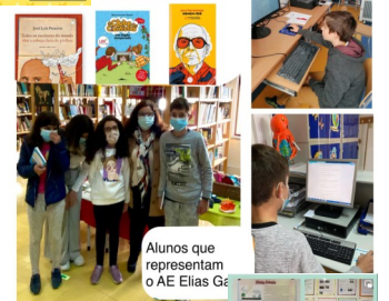
Alunos que representam o AE Elias Garcia

da 15.ª edição do Concurso Nacional de Leitura.