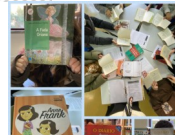
Clube de leitura 4.ºA