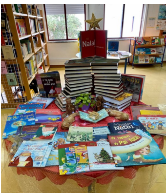
Exposição bibliográfica sobre o Natal

Estão escolhidos os livros que vão às eleições de Miúdos a Votos .