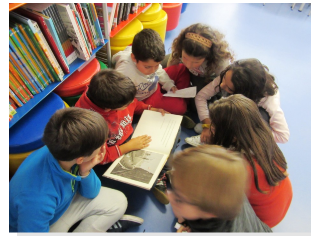
Clube de leitura