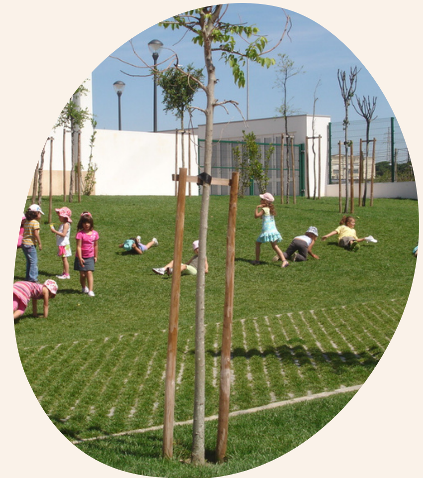
Relatório de autoavaliação do Agrupamento