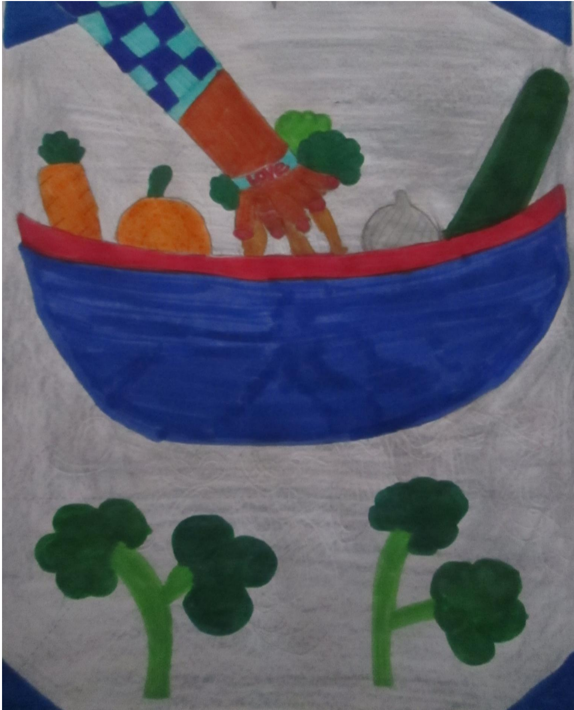
Cartaz realizado pela turma do 5°C