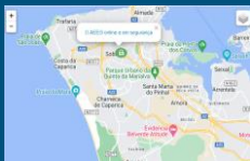
Georreferenciação da escola